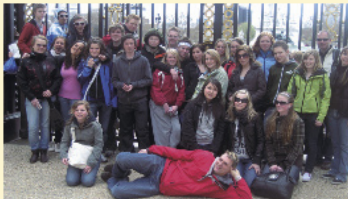
Gruppebildet foran Buckingham Palace i London fra årets tur.