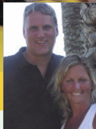
Pastorparet gleder seg til å komme i gang igjen...

Vi gleder oss over at Misjonskirken snart er ferdig oppusset og at det er aktivitetene som får full oppmerksomhet fremover.