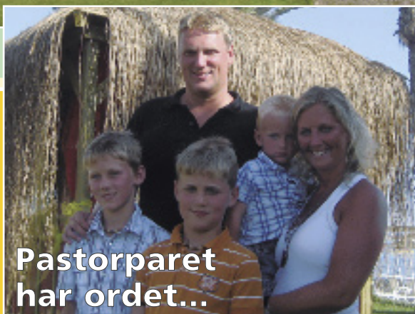
Pastorparet har ordet...