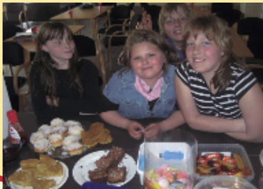
Maten på kafeen er alltid populær.