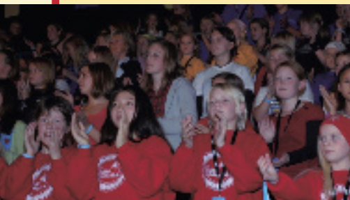
Fra Barnekor-festivalen i Kragerø.

*) NB: Tidspunktet kan bli forandret til kl. 18.30-20.00. Mer info om dette på koret.